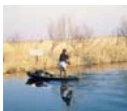
Des usages nombreux, souvent source de conflits. Petite Camargue gardoise Photo Anne Honegger.