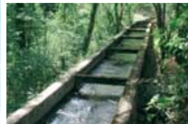
À l'échelle régionale, le Roussillon est l'exemple le plus vivace de cette irrigation traditionnelle de montagne.