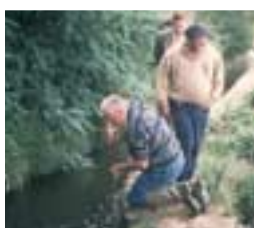
Un entretien entièrement pris en charge par l'agriculture dans le cadre d'une gestion démocratique.