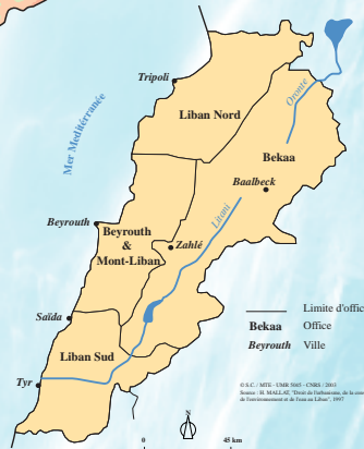
Le nouveau découpage des offices de l'eau