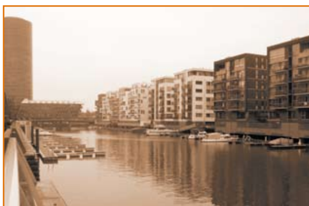
Constructions adaptées en zone inondable à Mayence Allemagne 2010

Il participe au programme « IDEAUX » (appel à projets « Eaux et territoires » 2008-2011) outre son activité d'enseignant (enseignements, rédaction et évaluation d'articles pour des revues de géographie et d'aménagement, participation à l'organisation de manifestations scientifiques, etc.). Ce programme a été mis en place dans le cadre d'un partenariat public (CNRS) privé (SOGREAH) en collaboration avec des organismes associatifs (Agence des 7) et scientifiques (Université Laval). Il traite de l'articulation, ou plutôt de l'absence d'articulation, entre les politiques de l'eau et les politiques d'aménagement en France (basse vallée de l'Ain, vallée de la Bourbre, nappe de l'est lyonnais) et au Québec (ruisseau de la brasserie à Gatineau dans l'aire métropolitaine d'Ottawa, basse rivière Saint-Charles à Québec) ; l'objectif étant de réinterroger les