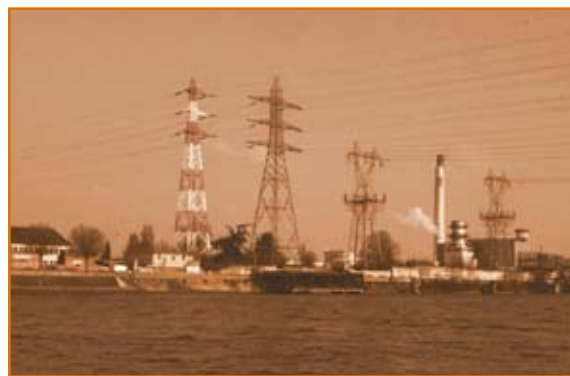
Les Ardoines à Vitry-sur-Seine vu d'Alfortville - 2010

Il a collaboré à plusieurs reprises avec l'Office national de l'eau et des milieux aquatiques sur l'organisation territoriale de la police de l'eau, le renforcement de l'efficacité des agents en charge de la protection de l'eau au travers de nouvelles formations tournées vers la connaissance des mécanismes d'urbanisation. Il a au reste conduit des travaux d'évaluation des politiques publiques en direction régionale de l'environnement ou bien encore en collectivité territoriale. Il a dirigé en 2009 deux numéros de la revue Economie Rurale consacrés aux acteurs de l'eau et a publié en 2006 avec Frédéric Lasserre Politiques de l'eau : grands principes et réalités locales aux Presses des universités du Québec.