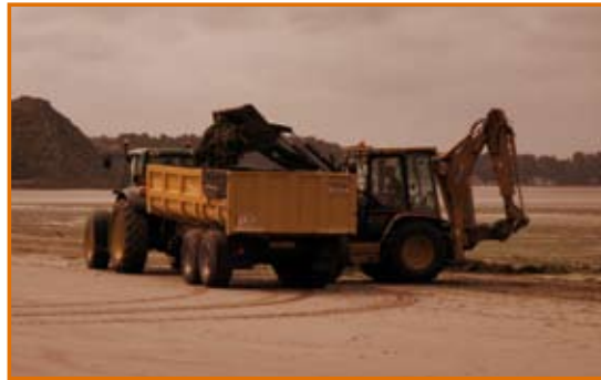
Ramassage des algues vertes en Côtes d'Armor - 2009